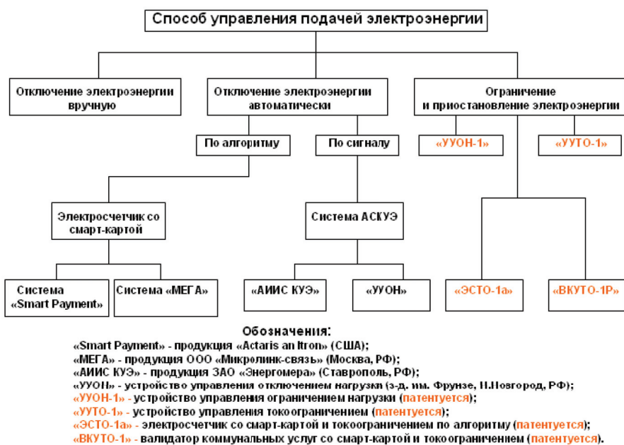
Рис. 1. Способы управления подачей электроэнергии собственникам помещений в МКД и устройства для их реализации

новые технические средства, разработанные при участии авторов настоящей статьи, и предназначенные для управления ограничением и приостановлением подачи электроэнергии потребителю. На практике пока используются только способы полного отключения электроэнергии, хотя в «Правилах коммунальных услуг» в качестве мер воздействия предусмотрено только ограничение и приостановление подачи электроэнергии, которые должны осуществляться по определенному алгоритму с уведомлениями о проведении указанных процедур при наличии у собственника помещения задолженности определенного размера.