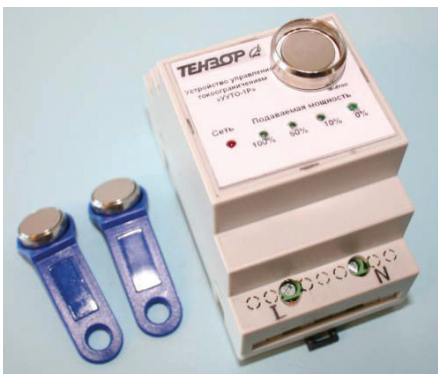
Рис. 4 — Внешний вид устройства «УУТО-1Р»

Устройство управления токоограничением «УУТО-1Р» также предназначено для ручного ступенчатого (от 100% до 0% туда и обратно) изменения мощности (величины тока), поступающей потребителю, с помощью